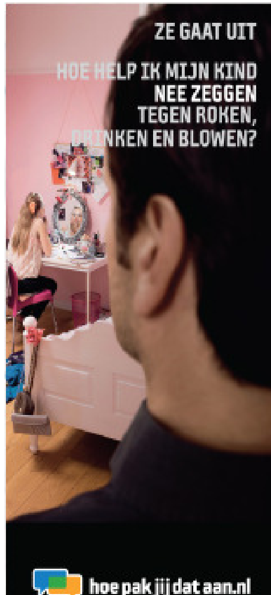
Banier opvoedcampagne 'Hoe help ik mijn kind nee zeggen ...'